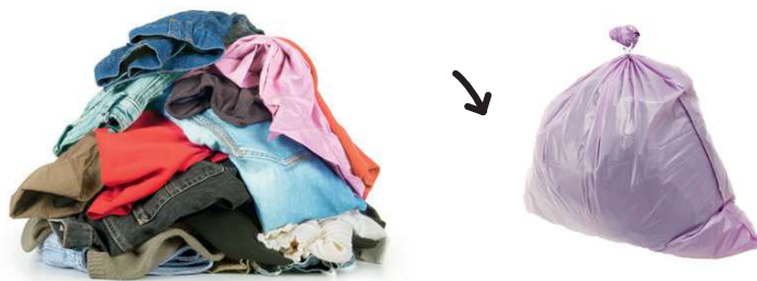
Vêtements, chaussures, maroquinerie

À DÉPOSER BIEN SECS ET PROPRES, MÊME ABÎMÉS, DANS DES SACS FERMÉS DE 30 LITRES MAXIMUM