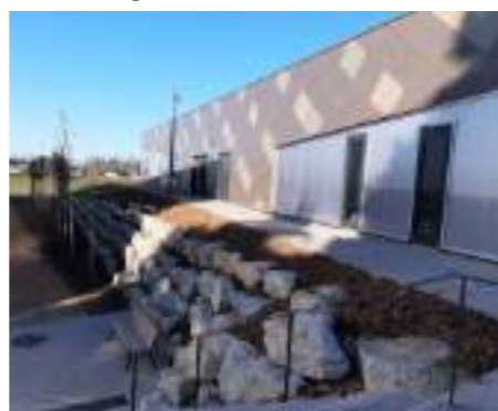
Aménagements extérieurs Seigneurie