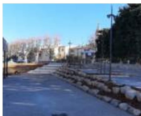
Aménagements extérieurs Seigneurie