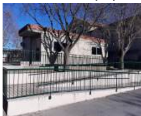
Rampe ERP PMR Ecole Barbizet