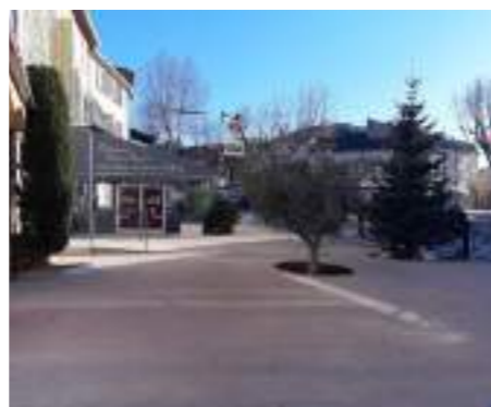
Réfection Place de la République