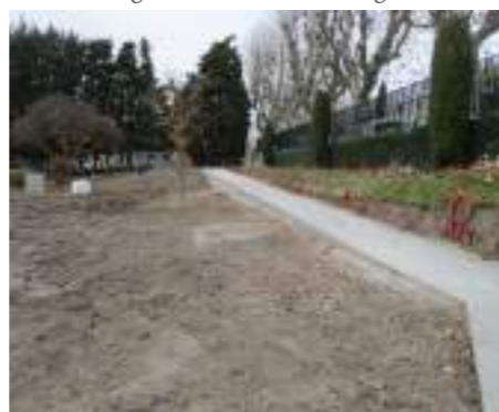
Rampe ERP PMR Stade Municipal