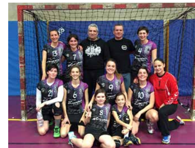
Les seniors féminines vainqueurs de Bollène après un match épique

Contact 06 85 66 80 18 contact@hbconcernade.com www.hbconcernade.com