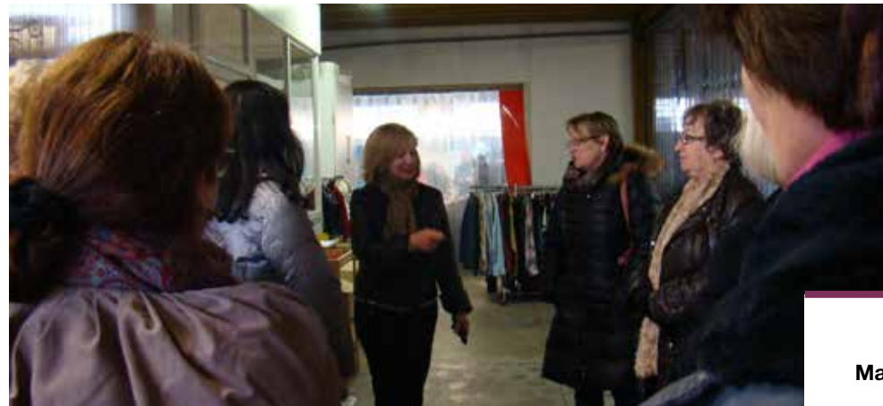
Visite des locaux de La fibre solidaire à Venelles