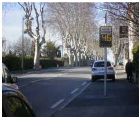
RD7n - En allant vers Lambesc