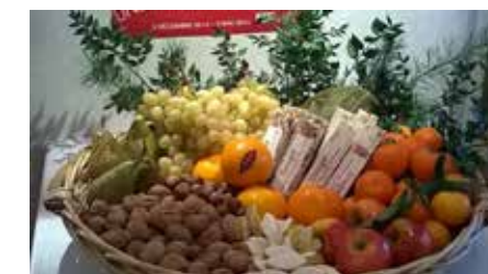
La belle corbeille du Poutagié