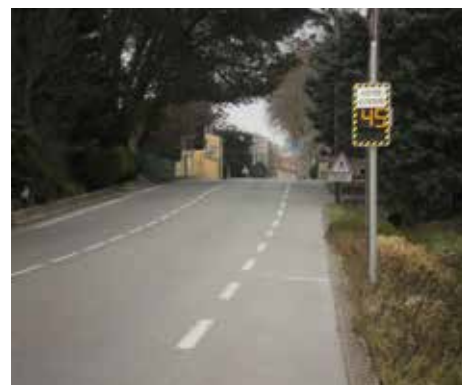
RD572 - Côté Pélissanne