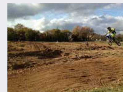
Le défi Moto Cross à la Pile

Les activités mises en place par des associations et des particuliers ont reçu cette année de nombreux participants.