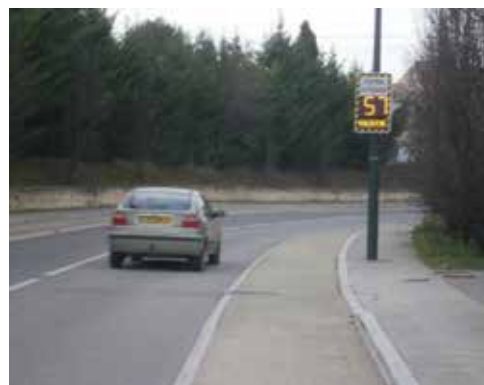
RD18 - Côté Rognes

Ces panneaux lumineux indiquent la vitesse des véhicules circulant sur la voie, et si celle-ci est supérieure à 50 km/h, il s'affiche un message pour le conducteur afin de l'inciter à ralentir.