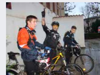
Les cyclistes téméraires du Téléthon

CELA FAIT 26 ANS QUE L'AVENTURE DU TÉLÉTHON EST NÉE... ET CELA FAIT PLUS DE 10 ANS QUE LE TÉLÉTHON CONNAÎT À SAINT-CANNAT UN ENGOUEMENT QUI NE FAIBLIT PAS !