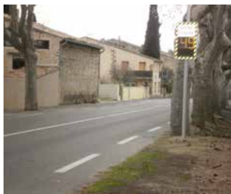
RD7n - En venant de Lambesc

AFIN D'AMÉLIORER LA SÉCURITÉ ROUTIÈRE À L'INTÉRIEUR DE L'AGGLOMÉRATION, COMME NOUS L'AVIONS ANNONCÉ, DES RADARS PÉDAGOGIQUES ONT ÉTÉ INSTALLÉS SUR LES GRANDS AXES ROUTIERS TRAVERSANT LA COMMUNE.