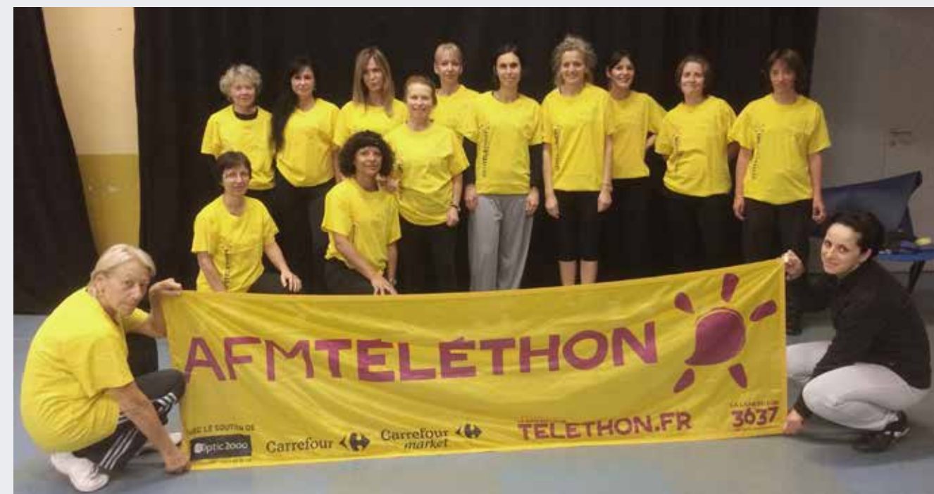
L'équipe de Sports et Loisirs