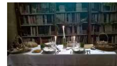
La table des treize desserts