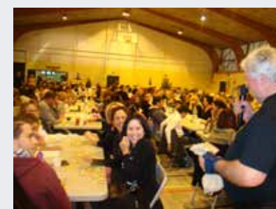
Une belle assistance pour le Loto

CELA FAIT 26 ANS QUE L'AVENTURE DU TÉLÉTHON EST NÉE... ET CELA FAIT PLUS DE 10 ANS QUE LE TÉLÉTHON CONNAÎT À SAINT-CANNAT UN ENGOUEMENT QUI NE FAIBLIT PAS !