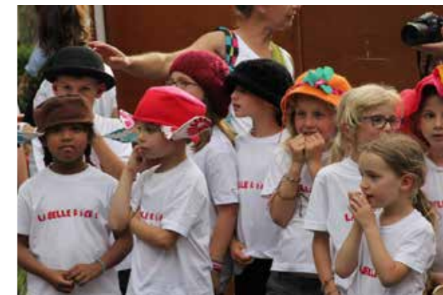
Les enfants à la Belle Récré 2014

Les responsables de l'ESCL Judo, du Yoseikan Budo, du Handball Concernade et du Foyer Rural