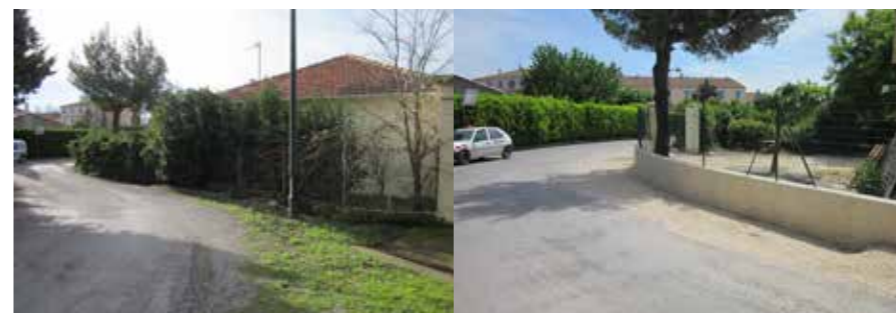
Chemin des Fumades avant travaux / Chemin des Fumades après travaux