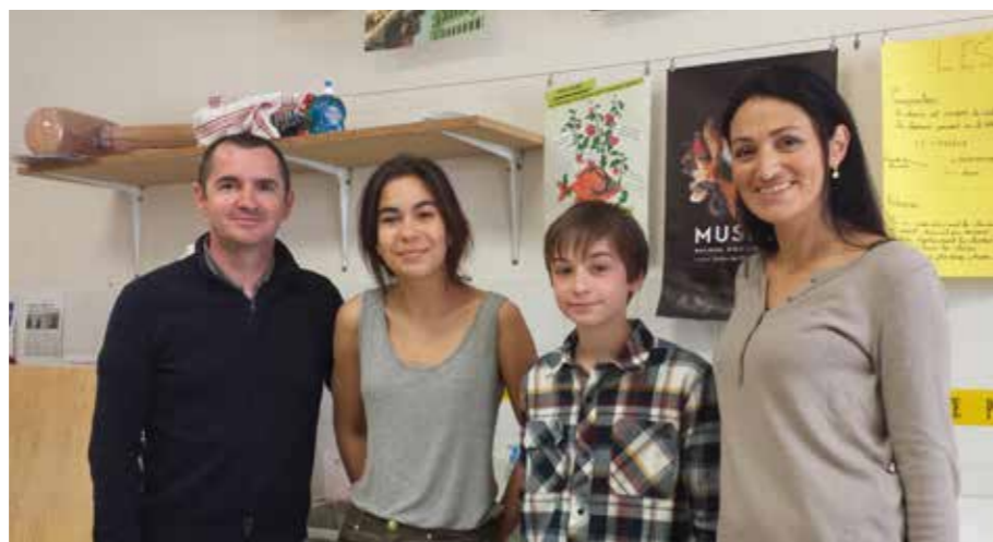
Concours Nouvelles avancées : les deux enseignants et les lauréats

Pour tous, un quizz était proposé afin de vérifier ses connaissances sur cette fête emblématique. Des cadeaux ont été remis aux plus performants.