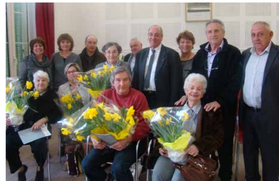
Les concurrents 2015 de Villes et Villages Fleuris