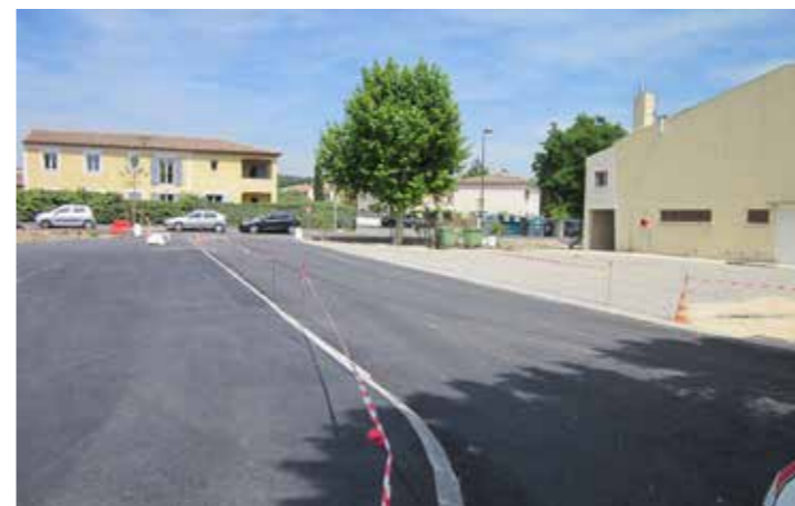
Voirie Rue Robespierre et Esplanade