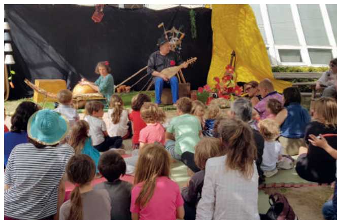
Jardinage tendre - Maïrol Cie

Merci aux associations st cannadènes qui se sont impliquées à la Belle Récré. Champ libre, le Fil d'Ariane, la Cie Amarande, les A.I.L. Merci à l'équipe de la crèche tou Cannat'ou pour l'accueil du spectacle Jardinage tendre de Maïrol Cie.