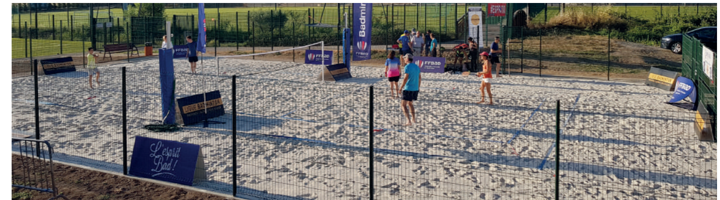
Étape du Airbadminton Tour 2019 le 16 juillet

Inauguration officielle du Beach Volley Vendredi 30 août à 19h