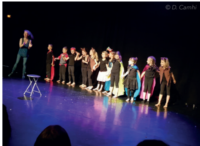
Enfanfarinés et compagnie - Spectacle des 6-7 ans - Belle Récré 2019

RENSEIGNEMENT, RÉSERVATION ET INSCRIPTION 06 25 76 80 59 asso Champ Libre@free.fr