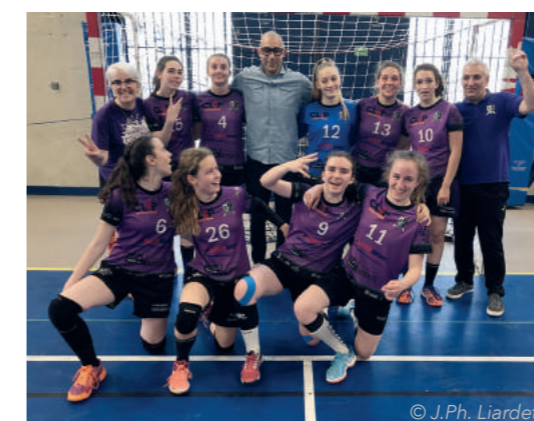
Les U17 Féminines