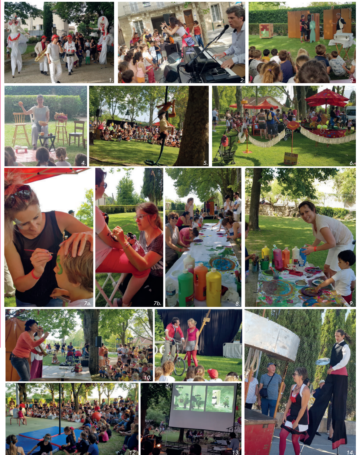
Toutes les photos sont sur saint-cannat.fr/Tourisme-et-loisirs/Culture ou sur Facebook/ Festival La Belle Récré