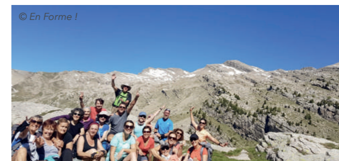
Randonnée en Haute Bléone