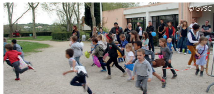
Chasse aux œufs

Je remercie aussi Géant Casino de Lambesc, pour sa généreuse dotation, ainsi qu'Intermarché de Lambesc et Leclerc de Salon de Provence.