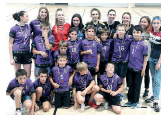
Les U11 mixtes

de qualité pour progresser, avec la possibilité pour les plus motivés de s'entraîner trois ou quatre fois par semaine. Alors si tu es sportif, motivé, nous t'attendons pour faire quelques essais. Nous recherchons plus particulièrement des gauchers et des filles.