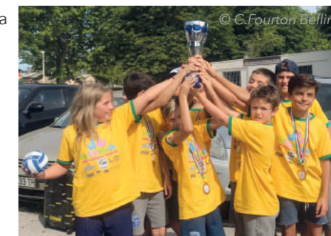
Le retour victorieux