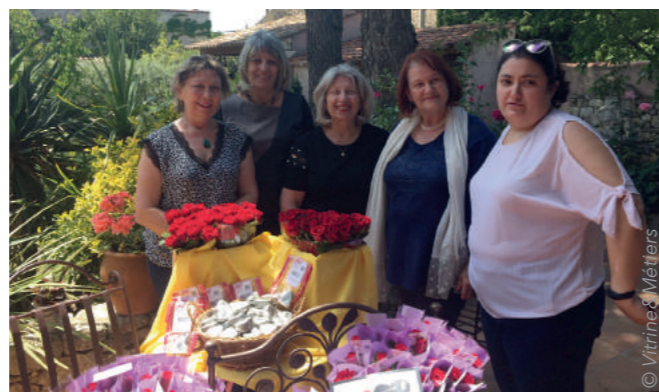
Le conseil d'administration en pleine préparation de la Fête des Mères

Si cela vous intéresse, contactez-nous ! L'équipe de Vitrites et Métiers