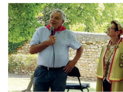
Le Pt du Cofet remercie la Confrérie des Chevaliers de l'Aiet