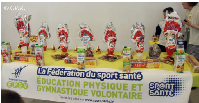
Goûter de la chasse aux œufs

La GV a participé à toutes les manifestations en faveur de la forêt. Quant à la cagnotte mise en place sur leetchi.com. "Reboiser St-Cannat", elle est toujours active. Ne l'oubliez pas. Elle sera d'ailleurs ouverte lors du Concert Planet'Jeunes organisé au profit du reboisement de la Forêt st cannadène le samedi 30 novembre salle Yves Montand. Concert couplé d'une exposition de l'Entente pour la défense de la Forêt.