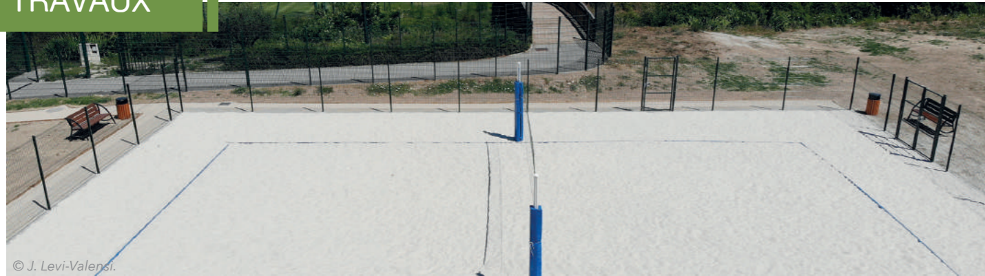
Aménagement du Beach Volley