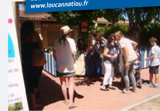
Retrouvailles dans une ambiance champêtre et estivale

Route de Rognes 04 42 57 33 18 Service pédagogique : loucannatiou@yahoo.fr Direction : direction.enfantsetloisirs@orange.fr Secrétariat : secretariatael2@orange.fr www.loucannatiou.fr