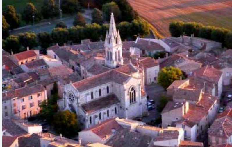
Prise depuis la cabine d'un hélicoptère