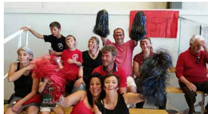
Vices championnes U11 F 2015