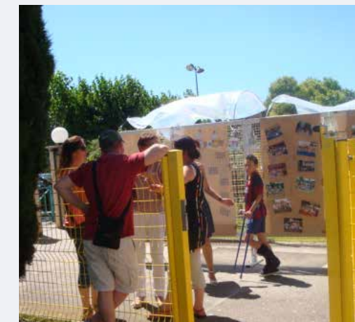
Souvenirs photos tantôt émouvants ou hilarants

L'association Enfants et Loisirs a fêté ses 30 ans le samedi 20 juin !