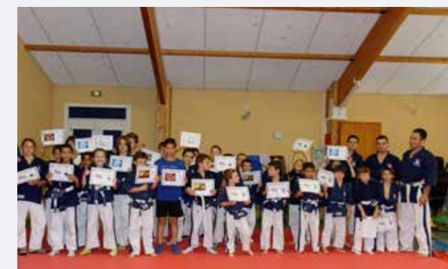
Remise des diplômes enfants le 6 juin

3 champions de France, 2 ceintures noires, un 2 ème Dan et 3 nouveaux animateurs fédéraux