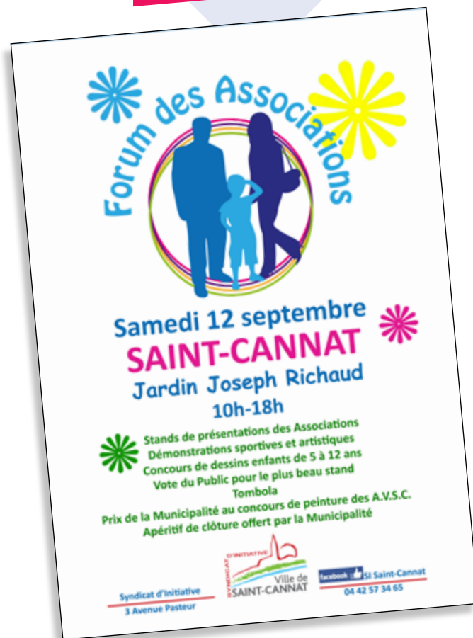
Réalisation D. Camhi

Marché de Noël Samedi 21 novembre 10h-18h Place Gambetta et Boulevard Parraud