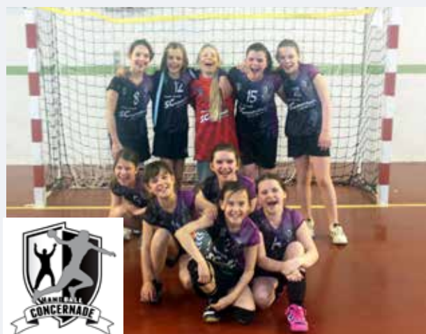
Les -12 ans championnes des Bouches-du-Rhône