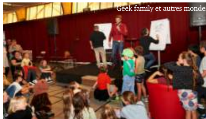
Geek family et autres mondes