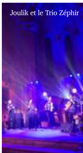
Joulik et le Trio Zéphir