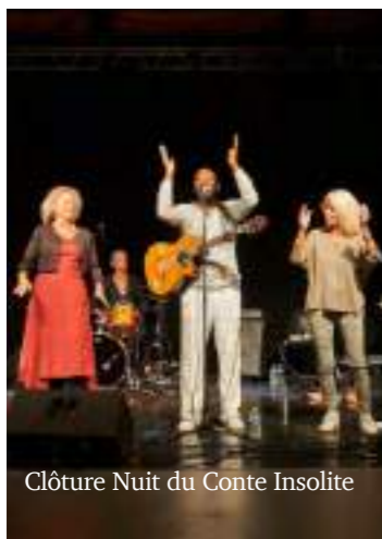
Clôture Nuit du Conte Insolite