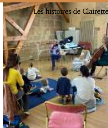
Les histoires de Clairette