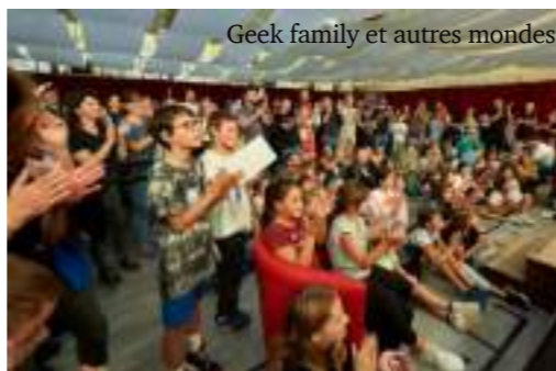
Geek family et autres mondes