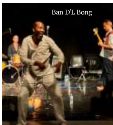
Ban D'L Bong