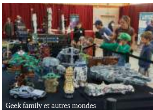
Geek family et autres mondes

04 42 50 82 10 bibliotheque@ville-saint-cannat.fr