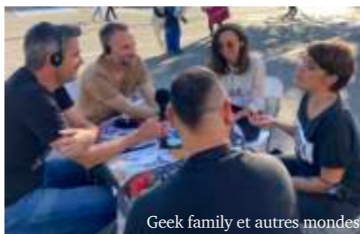
Geek family et autres mondes