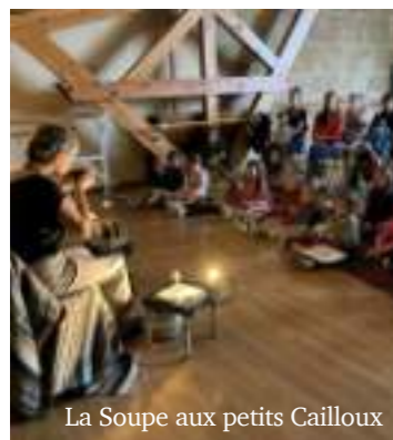
La Soupe aux petits Cailloux