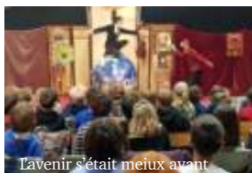
L'avenir s'était mieux avant