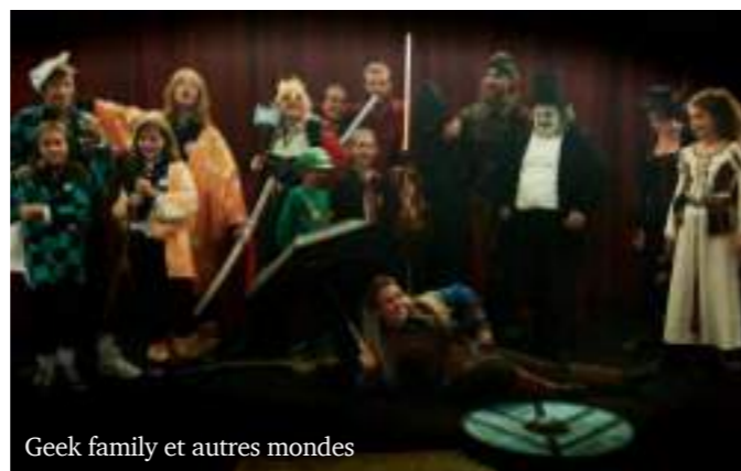
Geek family et autres mondes