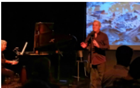
Spectacle "De l'eau, seulement de l'eau"