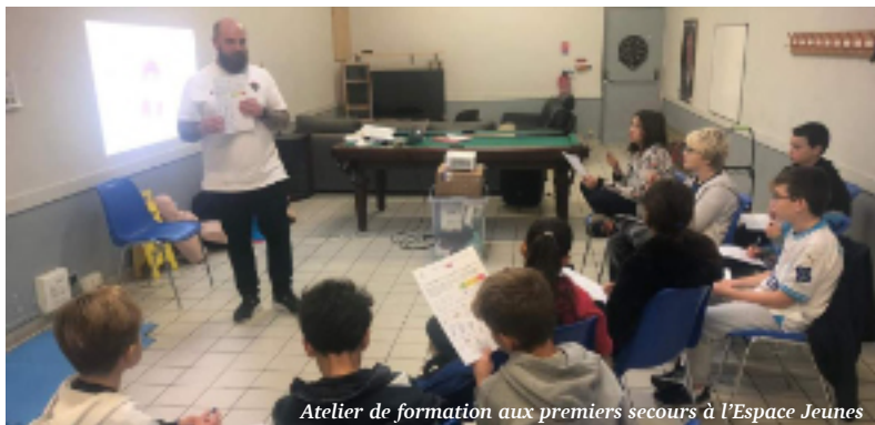
Atelier de formation aux premiers secours à l'Espace Jeunes

Le programme sera également remis dans les jours à venir aux parents. Pour les vacances d'avril 2024, un séjour en Espagne à Port Aventura est prévu avec visite de Barcelone.