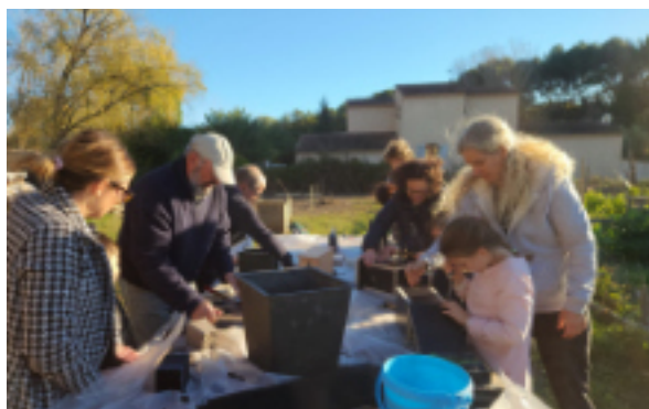
Ateliers Nature des Jardins du Budéou