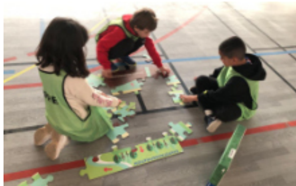
Ateliers Planète Perles pour les scolaires