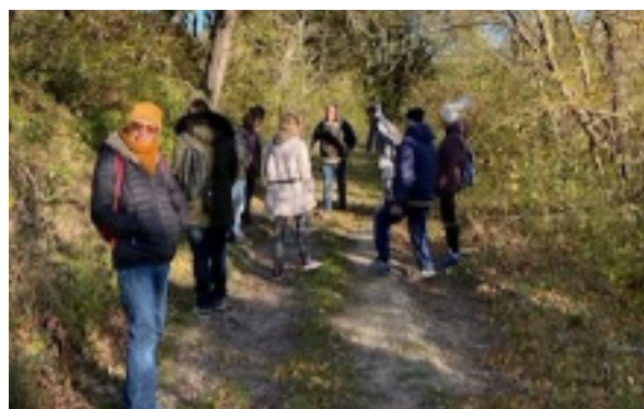
Sur les traces de la Touloubre, balade organisée par ToSem