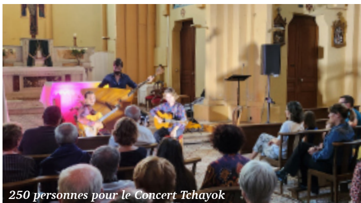
250 personnes pour le Concert Tchayok