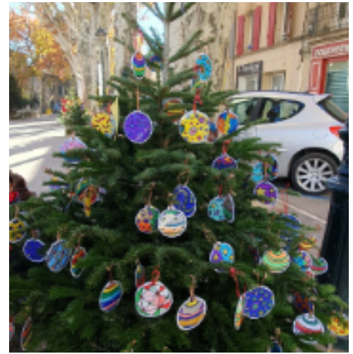
Les enfants du péricolaire ont participé aux décorations des sapins de Noël du village !

Les élèves ont été invités à des spectacles de Noël Toc Toc Noël pour les CP et la Maternelle Oh Kids ! pour les CE et CM Tous ont