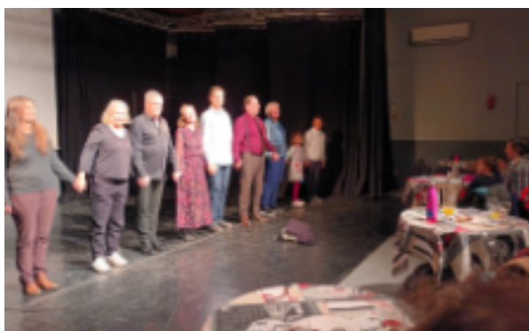
Les Lauréats. Spectacle "De l'eau, seulement de l'eau"