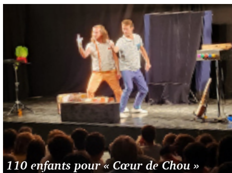
110 enfants pour « Cœur de Chou »