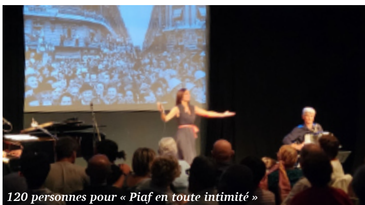
120 personnes pour « Piaf en toute intimité »