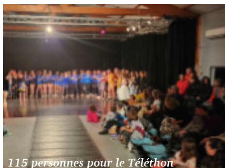
115 personnes pour le Téléthon