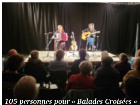
105 personnes pour « Balades Croisées »