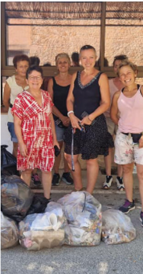
World Clean Up Day

En cette fin d'année 2023, il convient de faire un point sur nos actions achevées et celles en cours.