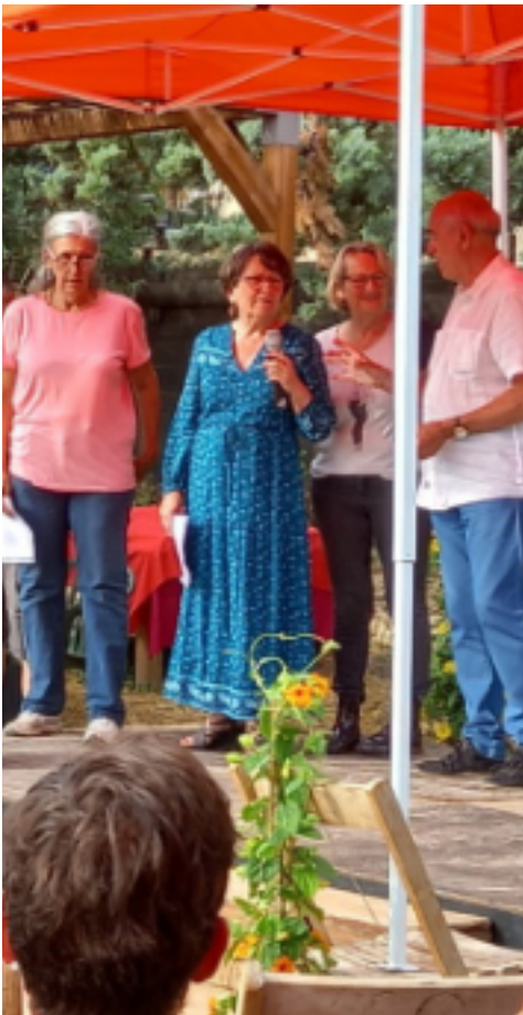
Inauguration des Jardins Partagés