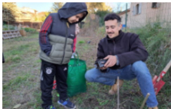
Ateliers Nature des Jardins du Budéou